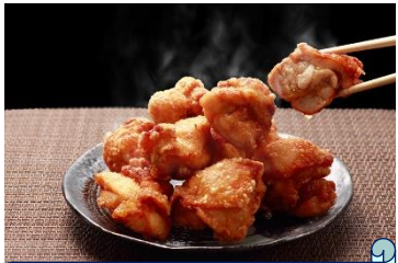
大分聖地中津からあげ 店舗：ぶんごや