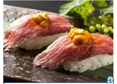
熟成肉ローストビーフ ウニのせ寿司 店舗：鉄板ダイニングだんらん