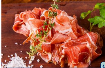
本場スペイン産イベリコ豚 熟成生ハム工房 店舗：イベリコ豚生ハム工房