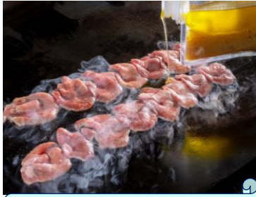
20会場売上No.1 トリュフオイルの極上牛タン 店舗：やきにくCHAN