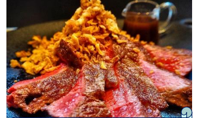
極上！牛ハラミステーキ！ 店舗：表参道 Lounge 1908