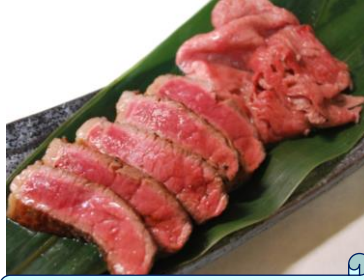
熟成佐賀牛 A4・A5ステーキ&焼きしゃぶ 店舗：肉処天穂