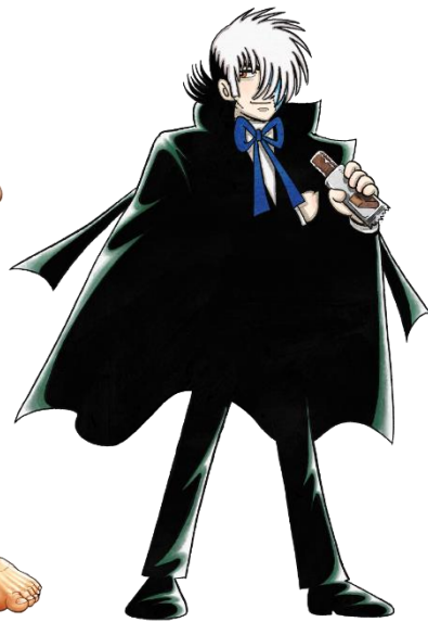
『ブラック・ジャック』 手塚治虫/手塚プロダクション作