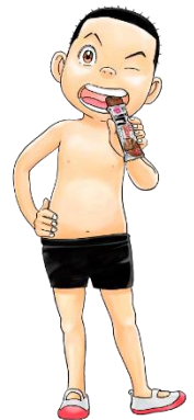
『あっぱれ!浦安鉄筋家族』 浜岡 賢次 作