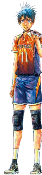
『ハリガネサービス ACE』 荒 達哉 作