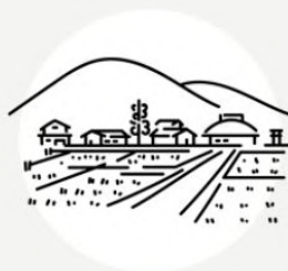
Life-changing cultural experiences