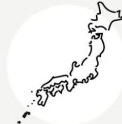
Collaborations between Japan and other countries