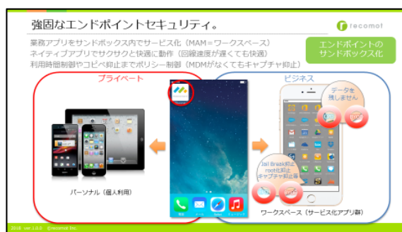
※「moconavi」は株式会社レコモットの登録商標です。