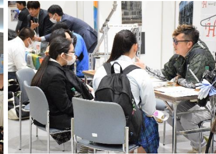
▲企業の話真剣に聞く生徒の様子（広島会場）