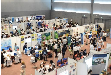
▲「ジョブドラフト Fes2024」会場全体の様子

2024年7月開催の詳細： https://prtimes.jp/main/html/rd/p/000000154.000048030.html