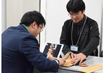
▲竹釘を打つ宮大工体験（岡山会場・建設）