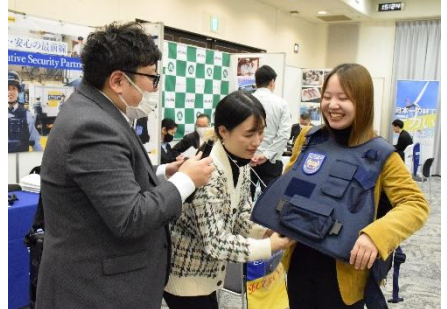
▲防弾チョッキを試着する体験（大阪会場・警備）