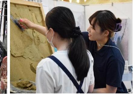
▲塗装体験（仙台会場・建設）