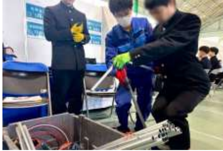
▲配管を曲げて繋ぐ体験