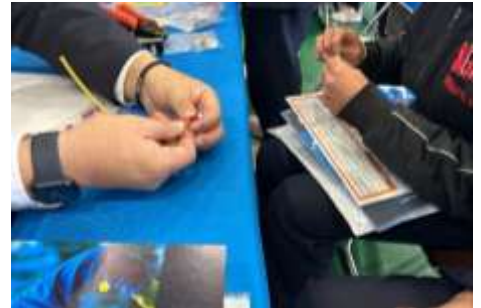
▲光ファイバーの接続体験