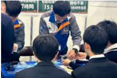
▲半導体の製品を実際に触ってみる体験