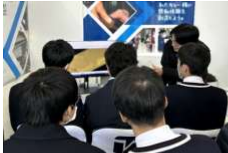
▲食品パックの3Dモデル図面の説明