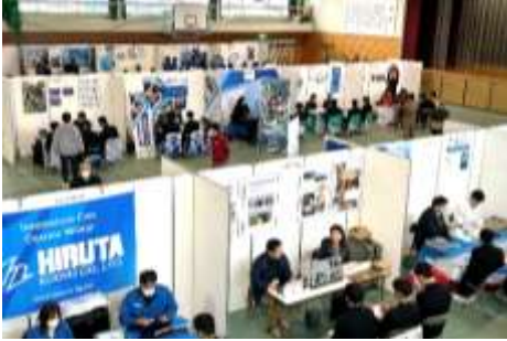
▲体育館会場の様子