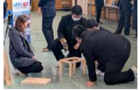
▲家具の組み立て体験