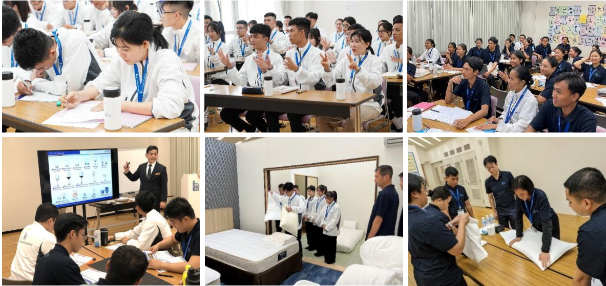
(入国後講習修了後の OFF-JT によるルームメイキング研修の様子)