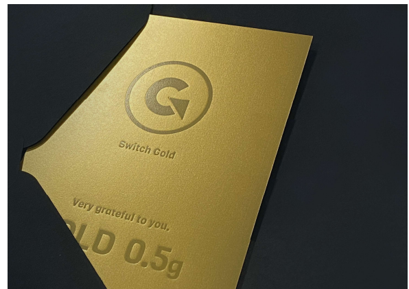
【贈呈されるギフトカード】(イメージ)