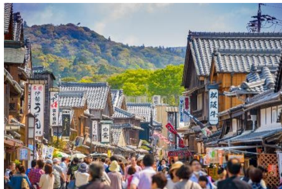
伊勢内宮前 おかげ横丁