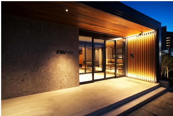
『FAV HOTEL TAKAYAMA』 外観

霞ヶ関キャピタル株式会社(本社：東京都千代田区、代表取締役：河本幸士郎、以下「当社」)はこの度、当社がホテル事業(開発・運用・売却等)に係るアセットマネジメント業務を受託している岐阜県高山市におけるホテル開発プロジェクトについて、『FAV HOTEL TAKAYAMA』(岐阜県高山市)を2020年10月26日に開業することをお知らせいたします。