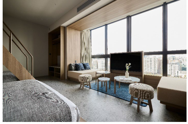
FAV TOKYO 両国 バンクスイート