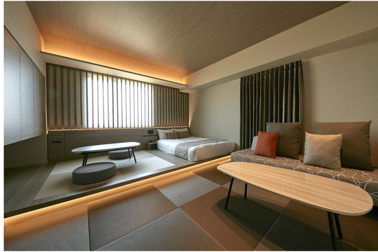
お部屋写真 (FAV HOTEL ISE)