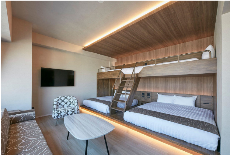
お部屋写真 (FAV HOTEL KUMAMOTO)