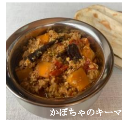
かぼちゃのキーマ

秋野菜をたっぷり使ったキーマカレー。鶏ひき肉とかぼちゃのバツグンな相性で食欲をそそります。