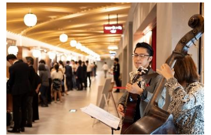
過去開催時の様子