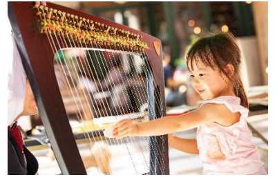
過去開催時の様子

体験楽器：ハープ、ピアノ、電子ピアノ、エレクトーン、アコーディオン、ハーモニカ、 打楽器(10月7日のみ)、サントリーホール オルガン VR 体験(10月8日のみ)ほか