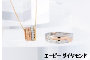
エーピー ダイヤモンド