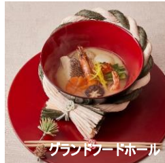
グランドフードホール