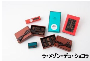
ラ・メゾン・デュ・ショコラ