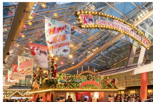
クリスマスマーケット(過去の様子)

今年で 18 年目を迎える、国内有数の老舗クリスマスマーケット。会場内は、世界最大と言われるドイツ・シュツットガルトのクリスマスマーケットを再現しています。ドイツオリジナルのクリスマス雑貨などを扱う 4 店舗では合計約 2,000 点のアイテムがそろそろほか、グリューワイン、ソーセージといった本格ドイツ料理の店など、合計 10 店舗が並び、心温まるクリスマスをお届けします。