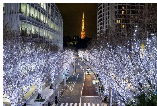
白色と青色のLED“SNOW & BLUE”(過去の様子)