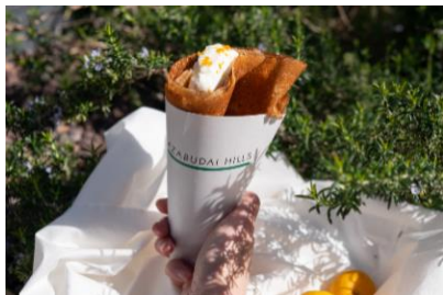
柚子フロマージュクレープ 980円

中央広場内の「麻布台ヒルズ キオスク」でも春の特別メニューが登場します。果樹園で採れた柚子を使った「柚子フロマージュクレープ」を限定販売するほか、中村藤吉の春限定焼き菓子「マルトバイク[抹茶]春さくら」も販売します。この時期だけの特別な味わいをお楽しみください。