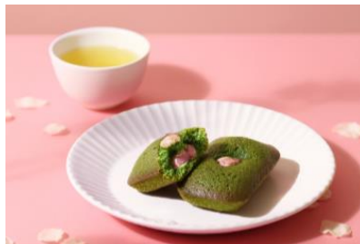
マルトバイク[抹茶]春さくら 390円