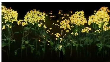
チームラボ《増殖する無量の生命-A Whole Year per Year》 ©チームラボ