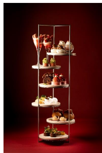
「Christmas AfterMOON Tea」イメージ