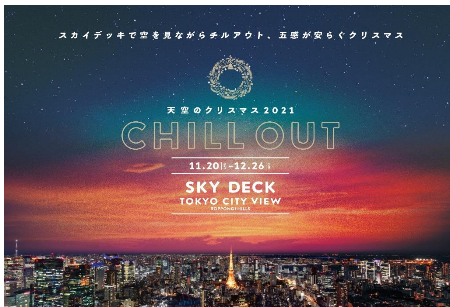
スカイデッキのクリスマス(イメージ)

好評開催中！「サンリオ展」のエントランスタワーがクリスマス仕様に 東京シティビュー併設レストラン「THE SUN & THE MOON」では 珠玉のクリスマスメニューが登場