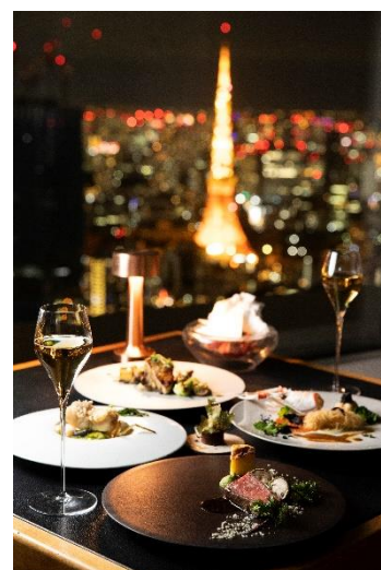
「Christmas Dinner Course」イメージ

※メニューの詳細は THE SUN & THE MOON (Restaurant)公式サイト( http://thesun-themoon.com/moon/news/ ) をご確認ください