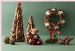
【ラスプ スパイスデコレーション】

卵型のお香人形「スモーキー」が人気商品。2021 年はスワロフスキー・エレメント付き「リトル・ドラマー」が限定で登場。