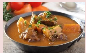
【フランクフルター ハウスマイスター】