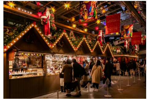
クリスマスマーケット(過去の様子)

開催期間：11月27日(土)～12月25日(土) 時間：11:00～21:00 場所：大屋根プラザ 協賛：フォルクスワーゲン グループ ジャパン 株式会社