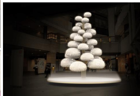
左：ケーテ・ウォルフアルト 中：ラスプ スパイスデコレーション 右：シュマツ