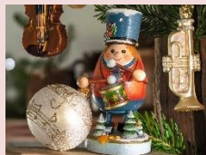
【ケーテ・ウォルフアルト】

日本では、この時期にしか出店しない貴重なお店「ケーテ・ウォルフアルト」をはじめ、多彩なお店が出店。お香人形「スモーキー」やオーナメント、リースなどを販売します。