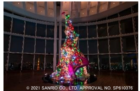
© 2021 SANRIO CO., LTD. APPROVAL NO. SP610376

六本木ヒルズ展望台では、11月1日(月)～12月26日(日)の期間、「天空のクリスマス 2021」と題して、展望台からの景色と融合した素敵なクリスマス体験をご用意します。森タワー屋上に位置するスカイデッキのクリスマスのテーマは「スカイ CHILL」。海拔 270m、360 度の眺望が楽しめる解放感たっぷりのオープンエア空間 スカイデッキでは、都会の中のアオアシとして様々なサービスで皆様に“天空の CHILL OUT 体験”をお贈りします。12月25日(土)には、毎年恒例の「クリスマス特別星空観望会」も開催します。52 階の屋内展望台 東京シティビューでは、「サンリオ展 ニッポンの可愛い文化 60 年史」を好評開催中。エントランスのシンボリックタワー「Unforgettable Tower」のイルミネーションがクリスマスバージョンとなり、展覧会と絶景のコラボレーションをお楽しみいただけます。