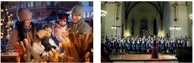
ラトビアのマーケットの様子 NHK 東京児童合唱団ユースシンガーズ

ラトビアで生まれたクリスマスツリーに込められた「冬の間に希望の光を灯す」誕生ストーリーにちなみ、“この世界の1番の宝物である次世代を担う子ども達へ、クリスマスに夢の光をプレゼントすること”をテーマに、文化、音楽、スポーツを代表する著名人による「ドリーム・ティーチャー」や、NHK 東京児童合唱団ユースシンガーズや、加藤登紀子さんによるコンサートなど特別なイベントを贈ります。ヒルズ カフェでは、ラトビアの現代料理を代表するシェフのオリジナルメニューを提供するほか、ライフスタイル雑貨や、日本でも人気の手編みミトンの展示、アニメーション映画の上映など、多数のアクティビティをご用意。さらに、クリスマスツリーが世界ではじめ飾られた都市リガから、ラトビアのオリジナルなクリスマスカードを届けるキャンペーンも実施します。