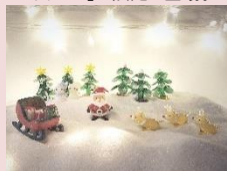
【ジョイラッククラブ】