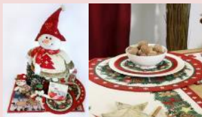
【アドヴェントショップ フロム ジャーマニー】