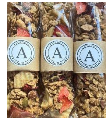
いちごバナナのメイプルバター・グラノーラ (Anboerie)