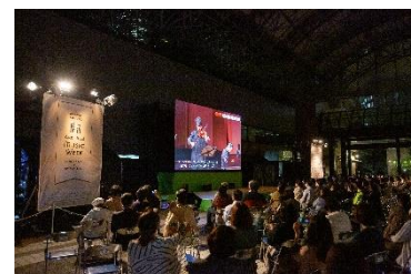
※過去開催の様子 (スペシャル・ライブ・ビューイング)