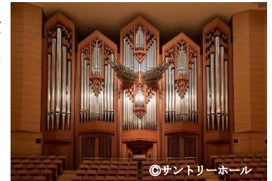
サントリーホール 大ホール

毎月1回ランチタイムに開催される無料のオルガンコンサート。10月の回は特別に声楽とコラボレーションして、サントリーホールのオルガンの豊かで荘厳な響きをより深くお楽しみいただけます。どこからでも気軽にご視聴いただける、無料オンライン(ライブ&リピート)配信も予定しています。