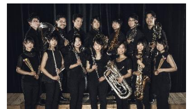
ブリッツフィルハーモニックウインズ

吹奏楽ファンはもちろん、お仕事帰りの方にも気軽に立ち寄れる、聴きどころ満載の吹奏楽コンサート！世界的に権威のある国際コンクールの優勝者をはじめ、ミュージカルやオーケストラなど各分野の第一線で活躍するメンバーが、聴き馴染みのあるポップスを中心に様々な楽曲をお送りします。