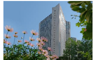
ANA インターコンチネンタルホテル東京

生演奏で聴かせるスタンダードジャズが、上質なロビー空間に華を添えます。「アトリウムラウンジ」でのティータイムや「カスケイドカフェ」でのディナータイムを、心地よい音楽とともにゆったりとお過ごしください。