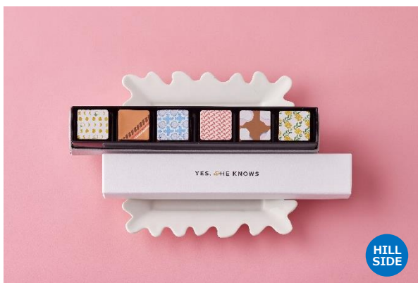
YES. SHE KNOWS PAIRING [6] ジー ケヤキザカ 5,500円

お酒を嗜む大人のためのボンボンショコラ6個の詰め合わせ。表面のチョコレートの層を極限まで薄くし、中に八重山諸島の新月の日の海水で作られた塩をはじめ、日本各地より選び抜いたさまざまな素材を組み合わせました。重層的な味わいと、豊かな余韻を楽しめます。