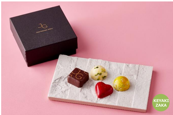
Chocolate Box 2023 ジャン・ジョルジュ トウキョウ 2,000円

ボックスを開けると登場するのは、アート作品のような美しいチョコレート。眺めるだけでも幸せな気分にしてくれるフォトジェニックなチョコレートを、『ROPPONGI HILLS SWEETS GIFT COLLECTION 2023』にラインナップします。世界の美食家を魅了し続ける「ジャン・ジョルジュ トウキョウ」からは、スパイス、ハーブ、お花の香りをテーマにした風味豊かな Chocolate Box 2023 が登場。人気イタリアンの「イルプリオ」では、“フルーツとお茶”をテーマにしたショコラ6種の詰め合わせ AOKI2023 を提供します。宝石のようなアーティスティックで美しいチョコレートの数々は、想いを込めたギフトはもちろん、ご自身へのご褒美にもおすすめです。