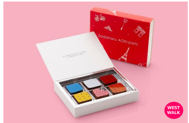
AOKI2023 イルプリオ 3,348円

“フルーツとお茶”をテーマにしたショコラ6種の詰め合わせ。3種の新作「ミルティーユ アールグレイ」「ジャスミン」「シトロン ミエル」と、人気の「フィグ」「パッション」、フランスの権威あるショコラ品評会で最高位を受賞した「プラリネ オレ」の6個入りです。