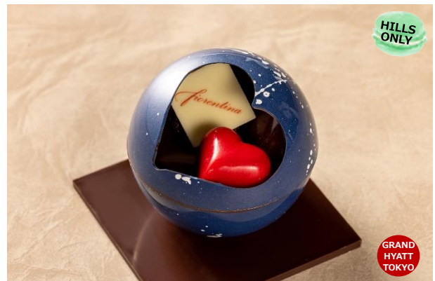
ショコラ コスモス フィオレンティーナ ペストリーブティック 3,500円

宇宙を思わせるデザインを施した直径7cmのチョコレートの球体に、ボンボンショコラなどを詰め合わせた「ショコラ コスモス」。ボンボンショコラはハート形のフレーズ、カフェ&グリオット、Grande H スweetの3種類。底にはアマンディーヌも入っています。