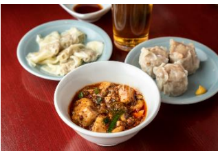
成都正宗担々麺 つじ田 ちよい飲みセット 1,000円

アークヒルズ3Fのレストランでは「さくら横丁」を開催。「飲めて、食べて、音楽を楽しめる」をコンセプトに、流し歌手の生演奏を聴きながらお食事を楽しめるエンターテインメント空間を提供します。パリなかやま氏やせきたさらい氏などバラエティ豊かなミュージシャンが、様々なジャンルの曲を生演奏でお届けします。参加する8店舗では、本イベントのために特別に用意した、お花見帰りのちよい飲みにぴったりなスペシャルメニューを1,000円でご用意。仕事帰りのお花見をお楽しみください。