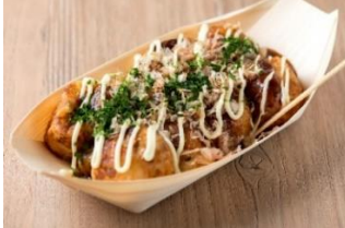
アーケヒルズカフェ たこ焼き 500 円

お花見を楽しみながら味わえる手軽なワンハンドフードや、シェアしながら楽しめるボリューム満点のメニューをご用意。