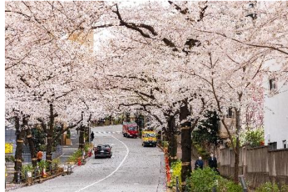
<幻想的な“桜トンネル”>