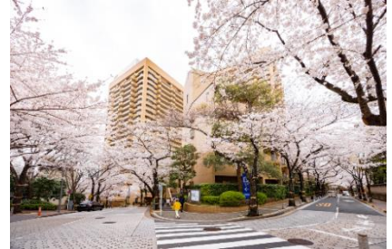
<目の前に広がる桜の花びら>