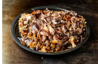
戸田亘のお好み焼 さんて寛 スジモダン焼き 1,000 円