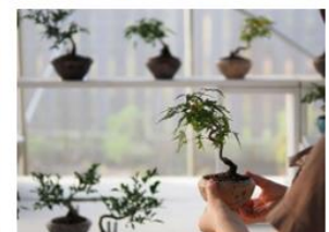
下段左から、成都正宗担々麺 つじ田「ちよい飲みセット」、日本橋海鮮丼 つじ半「海鮮さくら盛りセット」、「ちっちの紙芝居」、ものづくりワークショップ「小さな盆栽づくり」