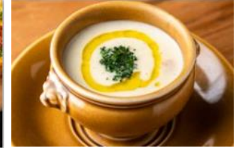
RUBY JACK'S Steakhouse & Bar グラムチャウダー 950 円