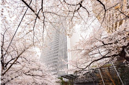
<高層ビルと桜のコラボレーション>

アークヒルズの敷地を取り囲む三方の道路（桜坂～スペイン坂）には150本の桜の木が根を張り、約700mにおよぶ並木道が続いています。これらは1986年の開業時に植樹され、40年近く経った今も力強く咲き誇り、都会の真ん中・アークヒルズエリアを桜色に染め上げます。また、泉ガーデン（運営：住友不動産株式会社）とその周辺の桜並木を合わせた距離は約1kmにも。道中に登場する都会では珍しい“桜トンネル”では、桜の世界に吸い込まれるような幻想的な雰囲気も体感いただけます。その他、高層ビルと桜がコラボレーションした都心ならではの風景や、ブリッジから臨む、目線の高さに咲き誇る満開の桜など、桜の様々な表情もお楽しみいただけます。