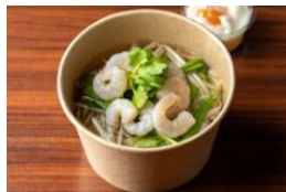
HALE 海's ベトナムフォー 1,000 円