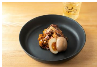
TOKYO MIX CURRY TMC ワンプレートセット 1,000円

大人気のぜいたく丼のネタを、特別に音楽横丁限定で提供します。まぐろ、中落ち、いか、数の子、つづ貝、みる貝、海老、いくらなど多彩な海鮮食材を使ったさくら盛りに、濃厚な黄身醤油をかけてお召し上がりください。