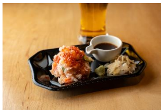
日本橋海鮮丼 つじ半 海鮮さくら盛りセット 1,000円

豚挽き肉、ネギ、豆腐そして秘伝の特製あわせ調味料を絶妙なバランスで仕上げた、山椒のぴりりと強めに効いた麻婆豆腐を、蒸したて肉汁あふれるシュウマイや皿ワンタン、ビールとともに楽しみください。