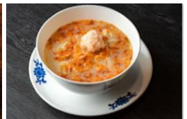
華都飯店 桜海老香る白湯鶏麵 800 円