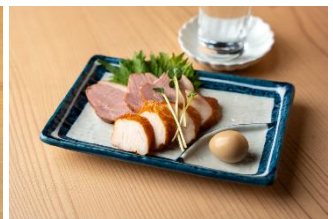
そば処 水内庵 鴨とささみのスモーク 1,000円

3種のゴマの風味とカロンジが香ばしい「ゴマかぼちゃ」、鶏モモ肉を塩麴に一晩漬けたみ焼いた「チキン塩麴焼」、醤油とワインベースの自家製のタレで漬けた「煮卵」をハイボールとセットで提供します。