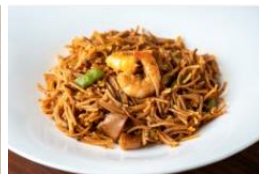
cafe-vino-tapas LA TAVERNA ハセガ 魚介のフィデウア 900 円