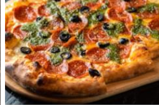
ウルフギャング・パック ピッツァバー MIXピザ 1P 400 円/ホール 1,000 円