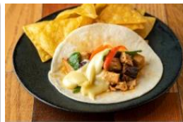
タコリッコ とろーりチーズチキンタコス 1p & チップス 600 円