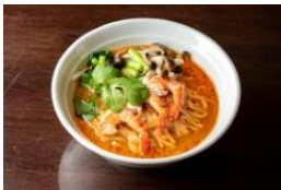
タイ料理 チャンロイ kaaw タイラーメン 1,000 円

近隣に大使館や外資系企業が多いアーケヒルズには多国籍なレストランが集うのも特長のひとつ。人気店がグルメ屋台に出店し、様々な国の料理を味わえます。