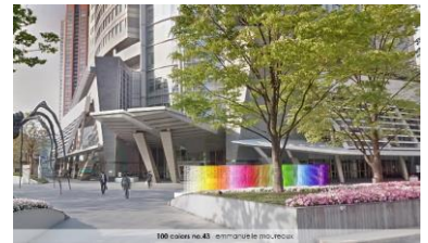
エマニュエル・ムホー 100 colors no.43「100色の記憶」 2023年（イメージ）

66 プラザに登場するのは、5 月末に開催される「六本木アートナイト 2023」に先駆けて展示されるインスタレーション『100 colors no.43「100色の記憶」』。100色のグラデーションと、六本木ヒルズが開業した“2003”年から、20年を迎える今年“2023”年の年号が織りなすインスタレーションは、記憶と時の流れを表現しています。手掛けたのは巣鴨信用金庫の建築設計、国立新美術館の「数字の森」、100 colors シリーズなどを代表作に持つ、今年事務所設立 20 周年を迎えたフランス人建築家でありアーティストのエマニュエル・ムホー氏。同じく 20 年を迎えた六本木ヒルズが、色褪せないカラフルな記憶を胸に、次のステージに進むよう願いが込められています。