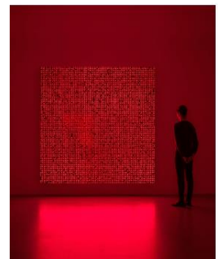
宮島達男《Innumerable Life/Buddha CCIOO-01》2018年 所蔵：森美術館（東京）