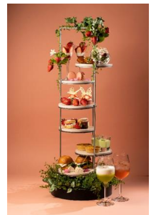
Premium Strawberry AfterMOON Tea