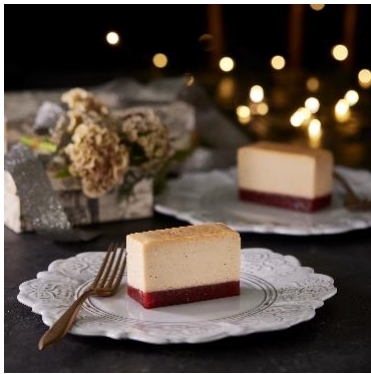
ホワイトストロベリーチーズテリーヌ ハグフラワー トウキョウ 1個入り 950円/6個入り 4,800円

北海道産の乳製品を使用した個包装のグルテンフリー・チーズテリーヌが人気の「ハグフラワー トウキョウ」。「ホワイトストロベリーチーズテリーヌ」は、チーズのほのかな酸味とストロベリージュレの爽やかな甘味がよく合う限定品です。チーズテリーヌはすべて冷凍の状態、1個から箱入りでご用意。半解凍にすればシャリっとした口当たりをお楽しみいただけます。