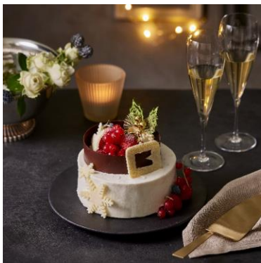
莓のデコレーションケーキ イルブリオ 5,500 円 (3~4 人用) / 7,200 円 (5~6 人用) EAT IN (1/6 カット) 900 円