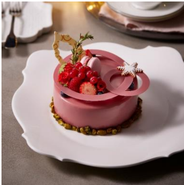
JG クリスマスケーキ ジャン・ジョルジュ トウキョウ 5,500 円

※12 月 21 日(木)~12 月 25 日(月)は当日販売もあり。ただし予約が埋まり次第完売となる場合があるため、事前予約がおすすめです。