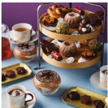
LE GOÛTER DE NOËL ル・ショコラ・アラン・デュカス 六本木 EAT IN 6,500円 (土日祝7,000円)