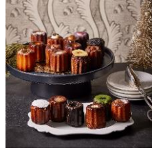
18BOX カヌレ ド キャンティ 4,000円