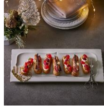
プチエクレール10個入 クレーム デ ラ クレーム 2,808円