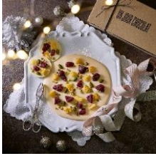
ラウンドショコラ クリスマス/ベビ ーラウンドショコラ クリスマス アンジュールショコラ 3,400円/390円