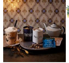
六本木アールグレイロイヤル ※写真左 紅茶専門店 テシエ TAKE OUT 980円