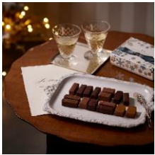
ノエルジヴレS1 ラ・メゾン・デュ・ショコラ 6,480円