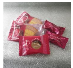
クリスマスギフトセット ニュースタイル銀座千疋屋 1,080円