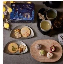
赤坂柿山「メリークリスマス」 巖邑堂「クリスマス上生菓子」(4種) 菓子の記録帖 赤坂柿山1,620円 ※売り切れ次第終了 巖邑堂各432円 ※1日5個程度(取扱無しの日もあり)