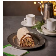
ロブションのシュトーレン ラ プティック ドゥ ジョエル・ロブション 小2,800円 (箱代別途350円) 大4,700円 (箱代込み)