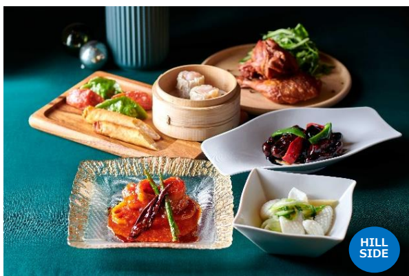
クリスマスオードブルセット 中国料理 ゴールデンタイガー