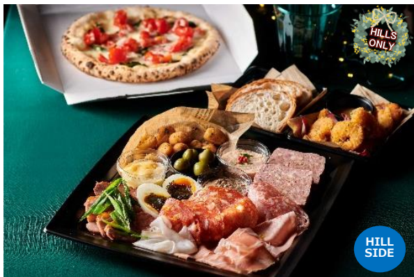
オードブルセット+ピZZA 毛利 サルヴァトーレ クオモ

「毛利 サルヴァトーレ クオモ」のオードブルセット+ピZZAは、人気のピZZA「D.O.C」と 7 種のメニューが味わえるので、色々な味をシェアしながら楽しみたい方にもピッタリです。本格四川料理を提供している「老四川 飘香小院」のクリスマスお持ち帰りセットは、お店で特に人気のメニュー 6 品をチョイスした、クリスマスシーズン限定のスペシャルなオードブルメニューです。今年のクリスマスは、六本木ヒルズの絶品オードブルで、ちょっと贅沢な『おうちクリスマス』を過ごしてみませんか。