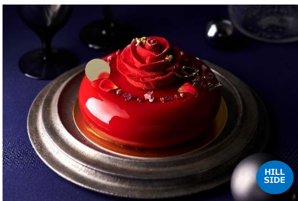
ノエル ローズ マリーアントワネット ラ プティック ドゥ ジョエル・ロブション