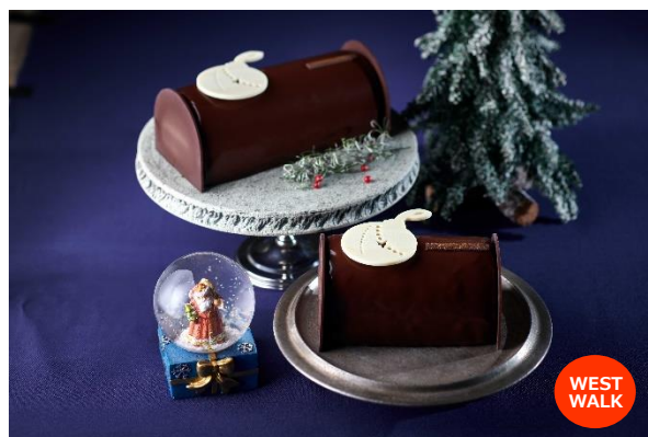
ピュッシュ ドゥ ノエル カラカス ラ・メゾン・デュ・ショコラ