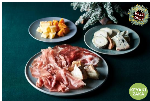
チーズ&ハムプレート ランマス