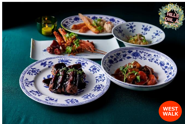
クリスマスお持ち帰りセット 老四川 飘香小院