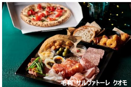
毛利 サルヴァトーレ クオモ