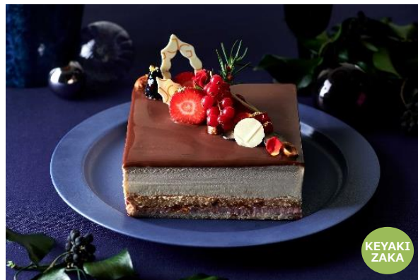
ガトー・ド・ノエル ジャン・ジョルジュ トウキョウ