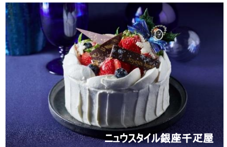
ニウスタイル銀座千疋屋