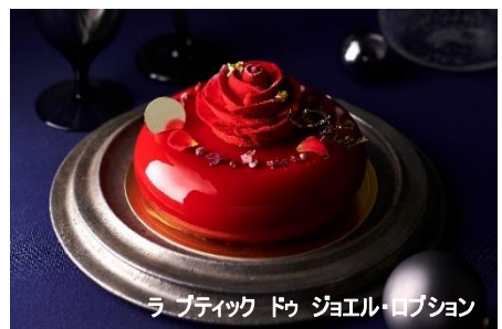
ラパティック ドゥ ジョエル・ロブション