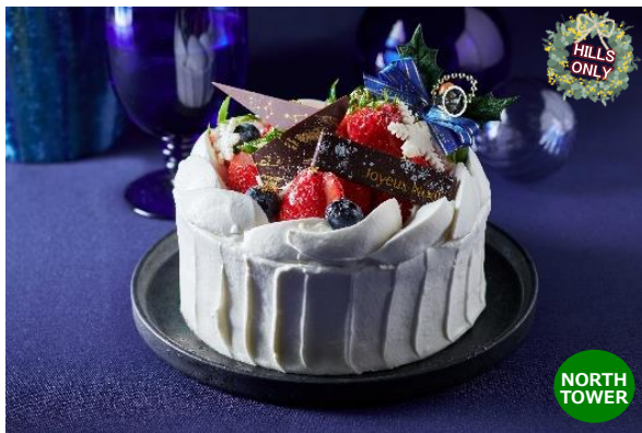
クリスマススペシャルデコレーションケーキ ニュースタイル銀座千疋屋

果物専門店「ニュースタイル銀座千疋屋」からは、厳選した極上のこだわりフルーツを惜しげもなく使用した、六本木ヒルズ限定のクリスマススペシャルデコレーションケーキをご提供。「ジャン・ジョルジュ トウキョウ」では、マルサラ酒が香るマスカルポーネのムースがちょっと大人なクリスマスを演出してくれるガトー・ド・ノエルを用意しました。パティシエの渾身のクリスマスケーキで、甘く濃厚なひと時をご堪能ください。