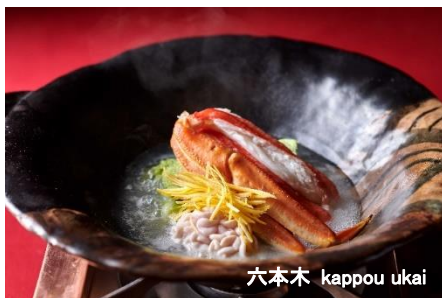
六本木 kappou ukai