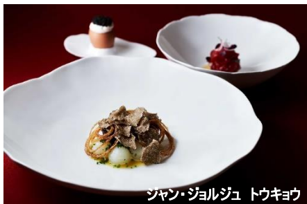
ジャン・ジョルジュ トウキョウ