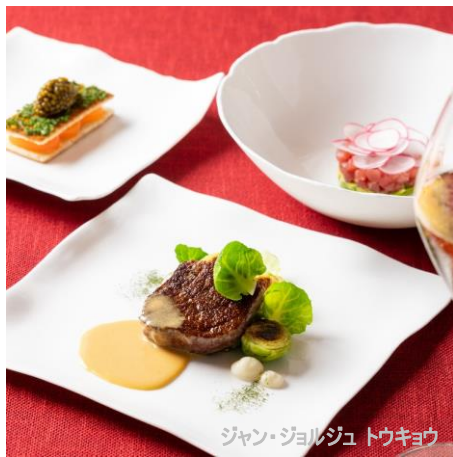
ジャン・ジョルジュ トウキョウ

舌の肥えた美食家をうならす名店から、伝統と革新を兼ね揃えたスイーツを提供するパティスリー、トレンドのフロントラインを走り続けるラグジュアリーブランド、そして上質な暮らしを演出するライフスタイルショップまで、個性豊かなショップ&レストランが軒を連ねる六本木ヒルズで、とびっきりのホリデーシーズンをお過ごしください。