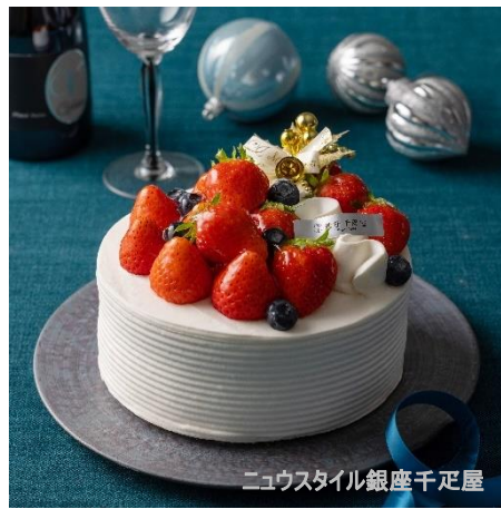
ニュースタイル銀座千疋屋