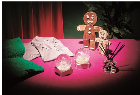
ルームウェア(ベアフットドリーム)※左奥 イングリッシュ ペアー & フリージア セント サラウンド™ ディフューザー(ジョー マローン ロンドン)※右手前

六本木ヒルズには、ファニチャーや生活雑貨、ベッドウェアまで多くのライフスタイルグッズを扱うショップもございます。こだわりのあの人にも喜ばれるライフスタイルグッズがきっと見つかるはず。