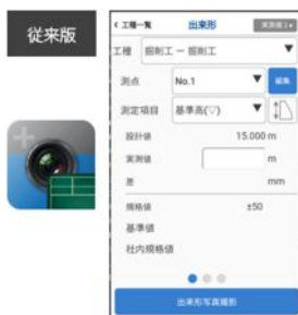
●アイコンの変更と、UIをハイコントラスト化