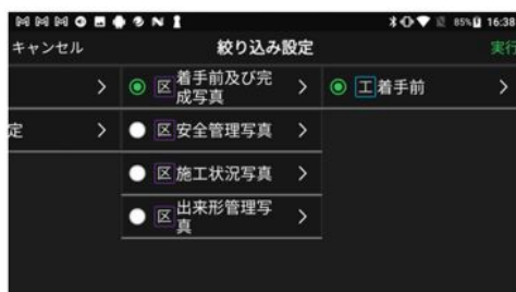
●黒板絞り込み選択