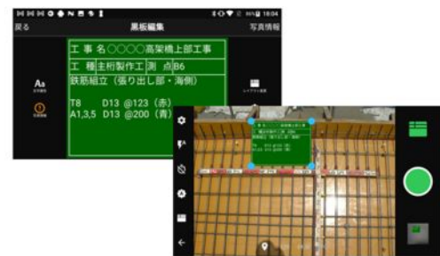
●メインメニューから直接カメラを起動