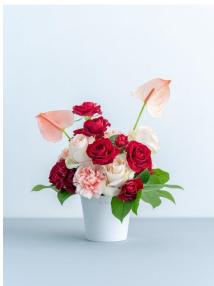
④バイカラーのローズアレンジメント 6,980 円