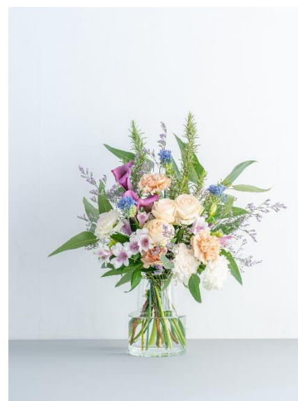
③カラーのブーケ パープル 9,980 円