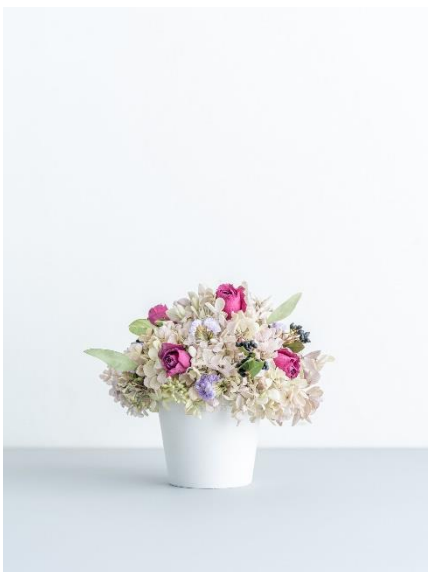
⑥ドライフラワー器アレンジ パープルローズ 6,980 円