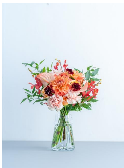
②ダリアのブーケ オレンジ 6,980 円