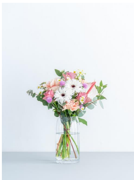
① ガーベラのブーケ ピンク 4,980 円