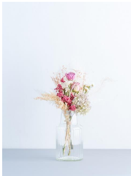
⑤ドライフラワー花瓶アレンジ ペッパーピンク 4,980 円