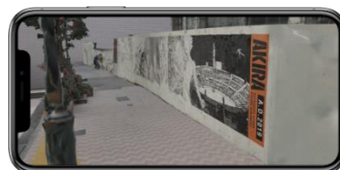
スマホにコンテンツが表示