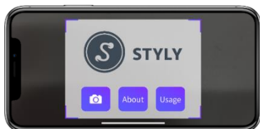
鑑賞用アプリ「STYLY」を起動

体験方法：お客さまのお持ちのスマートフォン/タブレットでご体験いただけます。会場にて掲出されたマーカー（QRコード）をアプリで読み込むことにより、空間上に浮かび上がるアートをお楽しみいただけます。