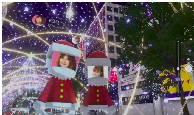
バーチャル渋谷 au 5G X'mas オープニングイベント「OPENING TALK SHOW」