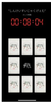
Netflix presents 『今際の国のアリス』特別上映会@ネットフリシネマ /『今際の国のアリス』“げえむちゃれんじ”