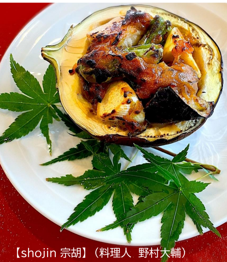
【shojin 宗胡】(料理人 野村大輔)

【shojin 宗胡】、【神楽坂天孝】、【日本橋ゆかり】、【神田雲林】、 【Casa di Camino】 ※順不同