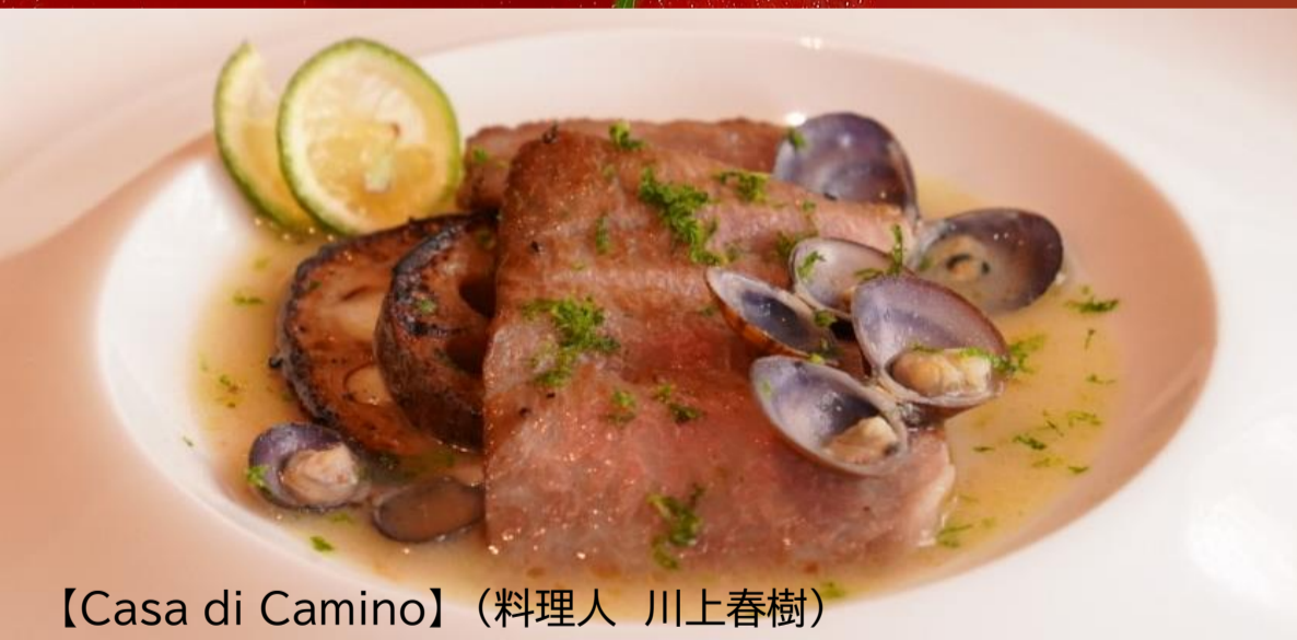
【Casa di Camino】(料理人 川上春樹)