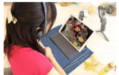
（イメージ：対応風景）