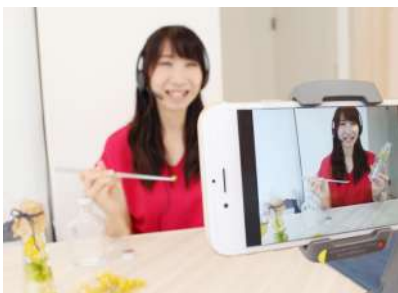
（イメージ：オンライン講師）