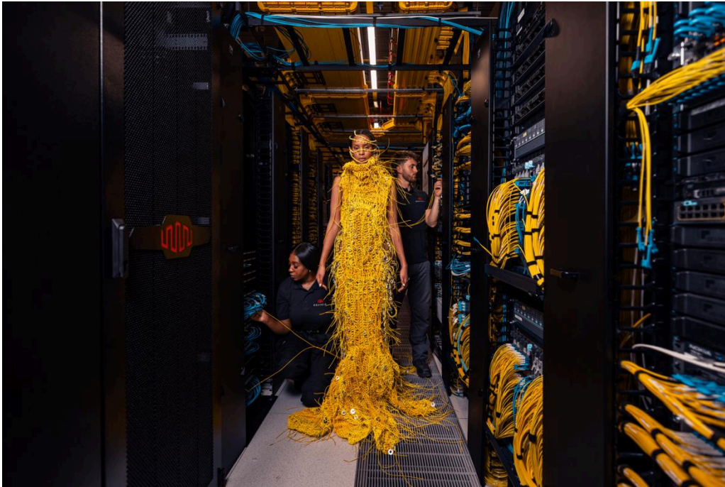
図 5 : クイニクスのデータセンター内、スタッフが作業する傍らに置かれたドレス

世界中のデータセンターには、このドレスの素材にも使われた光ファイバーケーブルをはじめ、重要な IT インフラストラクチャが収容されています。データセンターは、企業、AI モデル、クラウドサービス、ネットワークプロバイダーなど、多様な組織が相互に接続し、データを交換する場でもあります。