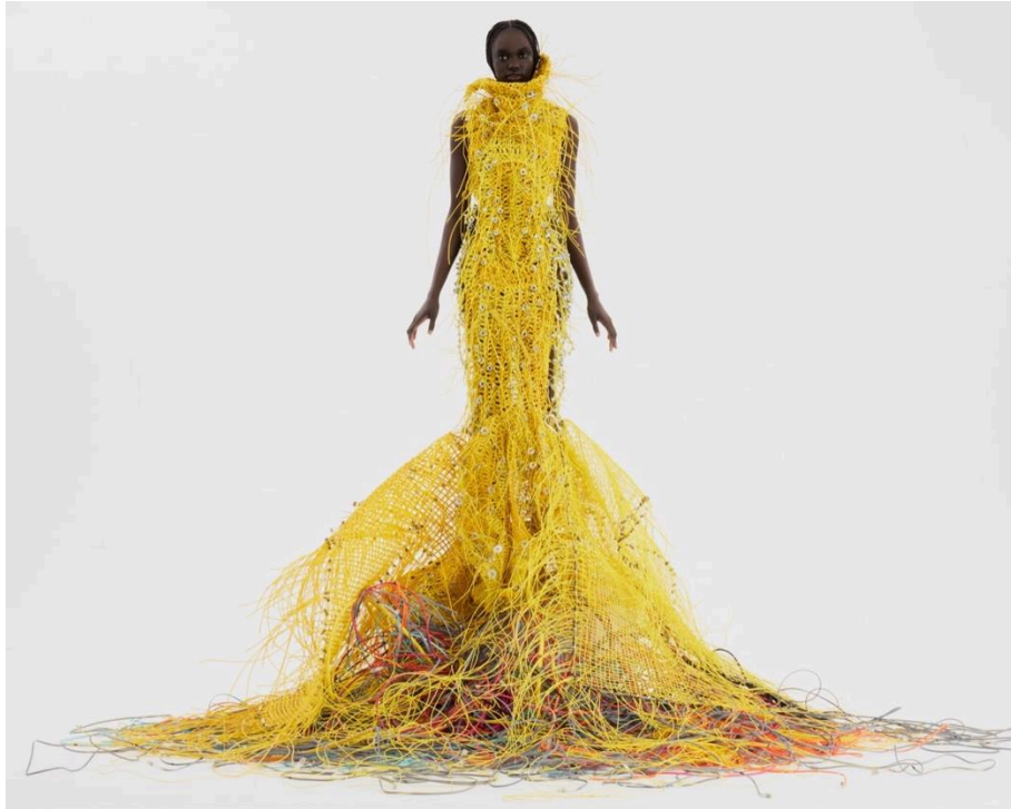
図1：データセンターのケーブルで作られた見事なドレス