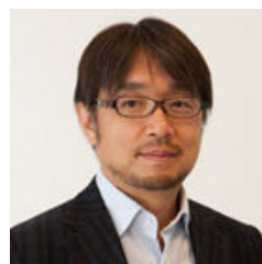
小山薫堂 (脚本家・放送作家)