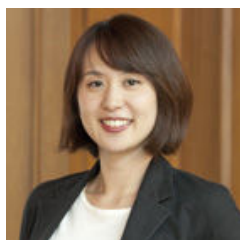
北川智子 (歴史学者)