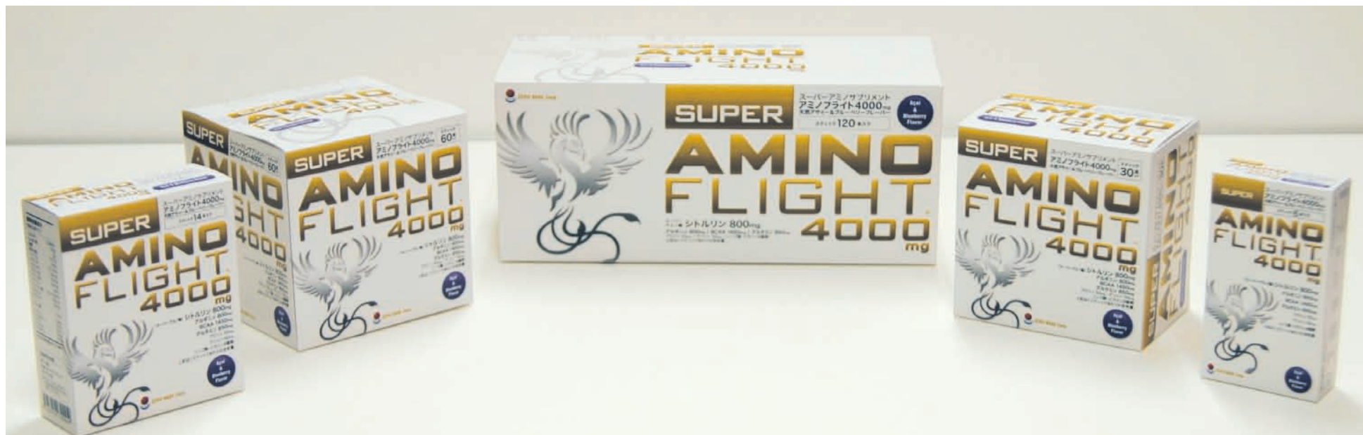
左から、14包、50包、120包、30包、4包入り