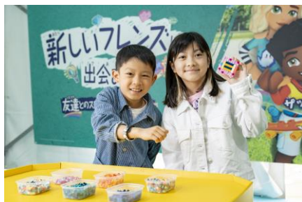
アート&クラフト withレゴ®フレンズ