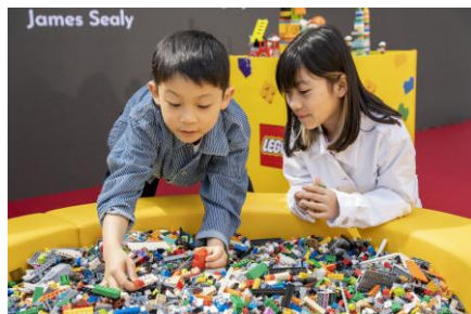
レゴ®ブロックプール

実施会場 : 仙台港、入間、木更津、横浜ベイサイド、北陸小矢部 実施日程 : 仙台港 2023年8月12日(土)~8月15日(火) 入間 2023年8月11日(金)~8月14日(月) 木更津 2023年8月13日(日)~8月16日(水) 横浜ベイサイド 2023年8月18日(金)~8月20日(日) 北陸小矢部 2023年8月11日(金)~8月15日(火) 実施時間 : 各日 10:00~18:00 参加条件 : 対象年齢 4歳以上