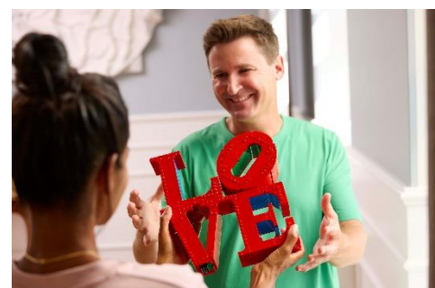
大切な人への贈り物にも