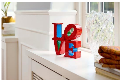
鮮やかなカラーでインテリアのアクセントに

「レゴ®アート LOVE」は、791ピースのレゴ®ブロックで構成されており、作品と同じデザイン、鮮やかな赤、青、緑のカラーが特徴的で、インテリアのアクセントとしてもぴったりです。また、このレゴ®セットには2種類の組み立て説明書が付属しており、大切な人と一緒に組み立てを楽しむことも可能で、プレゼントにも最適です。