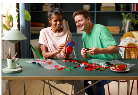
2種類の組み立て説明書で大切な人と一緒に組み立ても