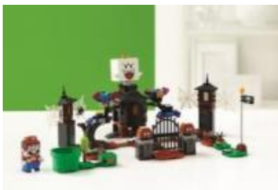
71377 バサバサ と キングテレサ の やしき チャレンジ