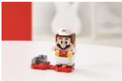
71370 ファイアマリオ パワーアップ パック