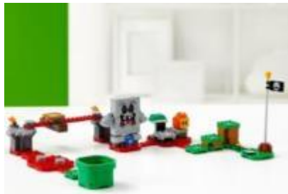
71364 バッタン の マグマ チャレンジ