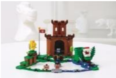
71362 とりで こうりやく チャレンジ