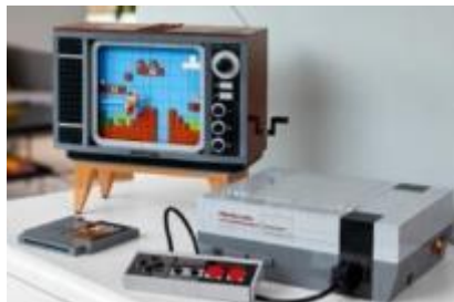
71374 LEGO® Nintendo Entertainment System™