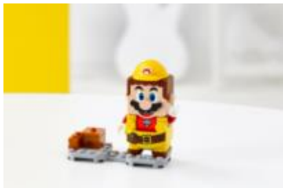
71373 ビルダーマリオ パワーアップ パック