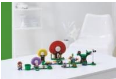
71368 キノピオ と 宝さがし