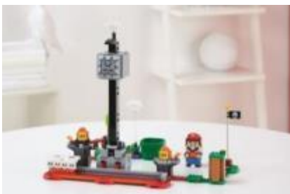
71376 ドッスン の ドキドキ チャレンジ