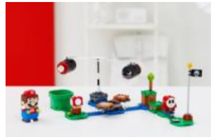
71366 マグナムキラー の ぐるぐる チャレンジ