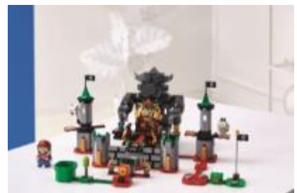
71369 クッパ城！ チャレンジ