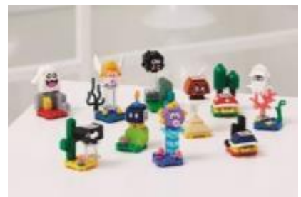
71361 キャラクター パック