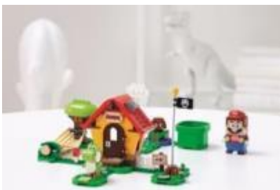
71367 ヨッシー と マリオハウス