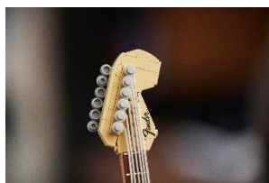
チューニングペグ