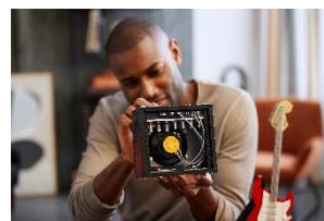
中身の見えるアンプ