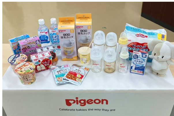
災害時優先供給物資