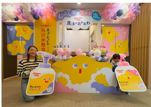
はにやにやちゃん（3才）とママ

いつもは私が娘を洗ってあげることが多く、たまに「自分で洗ってみる？」と声をかけて練習しているところでした。泡の色が変わるので、「キレイになるまで洗って」ではなく「色が変わるまでゴシゴシしてみようか」という声かけができて、そのサインが子どもにとってはすごく分かりやすかったようです。色の变化を自分で確認しながら、「色が変わった！」とニコニコして洗っている姿を見られて、私も嬉しくなりました。泡がホイップクリームみたいにクリーミーなもの、娘はすごく気に入ったようです。