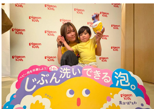
ボーヤくん（3才8ヵ月）とママ

いつもは私が娘を洗ってあげることが多く、たまに「自分で洗ってみる？」と声をかけて練習しているところでした。泡の色が変わるので、「キレイになるまで洗って」ではなく「色が変わるまでゴシゴシしてみようか」という声かけができて、そのサインが子どもにとってはすごく分かりやすかったようです。色の变化を自分で確認しながら、「色が変わった！」とニコニコして洗っている姿を見られて、私も嬉しくなりました。泡がホイップクリームみたいにクリーミーなもの、娘はすごく気に入ったようです。