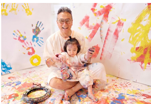
かいくん (3才) とパパ

普段、家の中では絶対にやってはいけないとされていることに思い切り挑戦できるのが、子どもにとっても大人にとっても本当に新鮮でワクワクする体験でした。最初は「本当にやっていいの？」と少しイタズラっぽく様子を伺っていた息子が、吹っ切れて全身でえのぐを楽しむ始めた時の、あの生き生きとした表情が本当に印象的で。こうした自由な体験ができる機会が、もっと全国の子どもたちに広がってほしいなと思います。