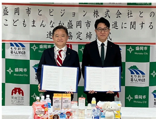
岩手県盛岡市との調印後の記念撮影の様子

当社の子育てに関する知見やノウハウ、資源、サービス等を活用し、平時にも、もしもの時にも、子育て世帯が安心して暮らせる「赤ちゃんや子どもにやさしい」地域社会の実現を目指します。