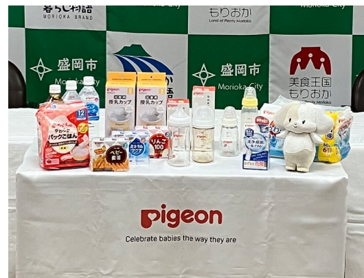
災害時優先供給物資