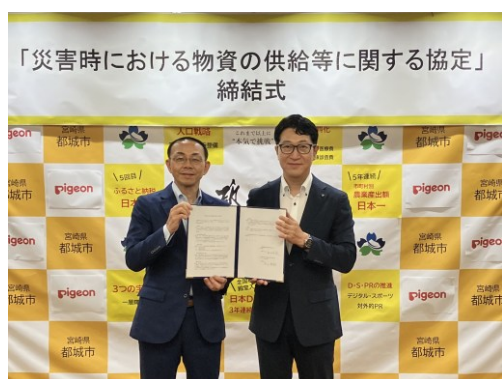
宮崎県都城市との調印後の記念撮影の様子

当社は、赤ちゃんや子育て家庭に寄り添う企業として、自治体との連携による子育て支援や「あかちゃんの防災」の普及啓発に取り組んでいます。本協定を通じて、平時からの連携を深めるとともに、災害時においても乳幼児や妊産婦を抱える家庭が安心して過ごせる環境づくりを推進してまいります。