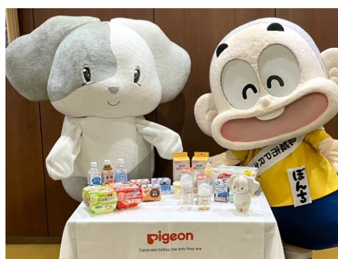
災害時優先供給物資