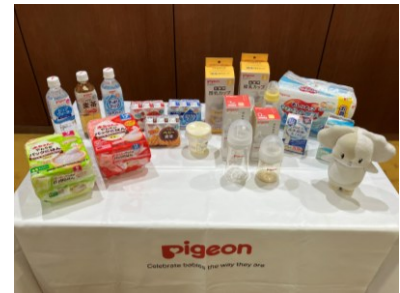
災害時優先供給物資