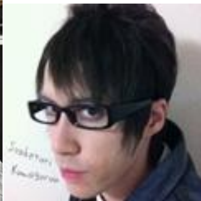
しゃけとり くまごろう