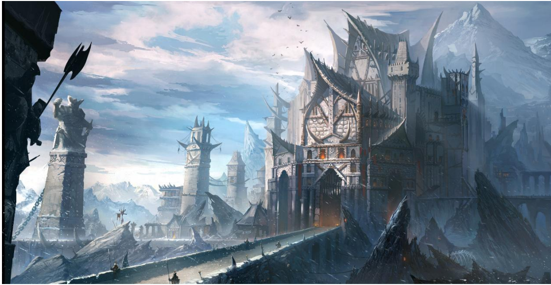
＜黒帝軍＞遠征根拠地 北の「フォート・チョールヌイ」

吹雪が絶えることなく吹きすさび万年雪が堆積する、神秘的な北方山脈への回廊に建設された「フォート・チョールヌイ」は、その名の示す通り厳しい気候条件の中に建設されました。