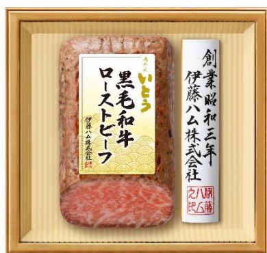
NT-120 本体価格 12,000 円

1本 500g とボリュームも充分です。また、5種の和洋惣菜セットも新発売します。牛肉と蓮根の甘辛煮や豚角煮、ビーフシチューなどをセットした、常温保存・レンジ調理が可能で簡便かつ小分けタイプのギフトです。24年中元期に発売した大阪発祥の人気おうどん店「つるとんたん」とのコラボギフトは、今歳暮、かけつゆのおうどんとお惣菜をセットして発売します。