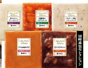
YOS-30 本体価格 2,800 円