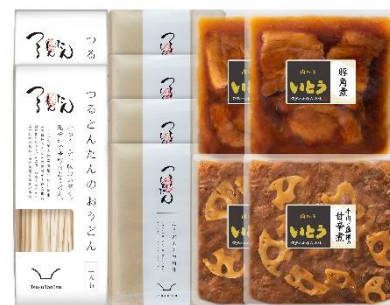
NT-58 本体価格 5,500 円