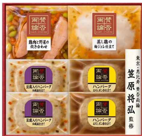
WH-35 体価格 3,000 円 セット画像・写真はイメージです。