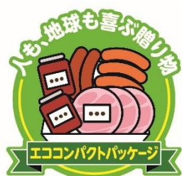
【エココンパクトパッケージ】

リサイクル率が高いダンボールを使用し、更に従来の化粧箱と比べ包装材料を減らすことで箱重量を 29%以上削減しました。商品を箱に入れる際に、縦に重ねることでコンパクトに収めることができ、輸送時やお客様が冷凍庫で保管される際もスペースを取らずに済みます。化粧箱には環境に配慮したものであることが伝わるように、「人も、地球も喜ぶ贈り物エココンパクトパッケージ」いうロゴマークを作成し、印刷します。