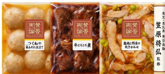
WD-401 本体価格 4,000 円