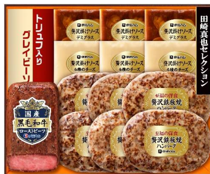
Y0-100 体価格 10,000 円