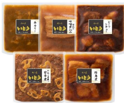
NT-35 本体価格 3,500 円