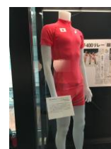
陸上日本代表ユニホーム/ リオデジャネイロ2016オリンピック (株式会社アシックス蔵)