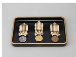
東京1964オリンピックの金、銀、銅メダル (秩父宮記念スポーツ博物館蔵)