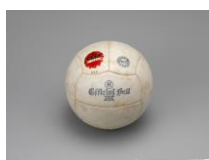
東京1964オリンピックの バレーボール公式球 (秩父宮記念スポーツ博物館蔵)