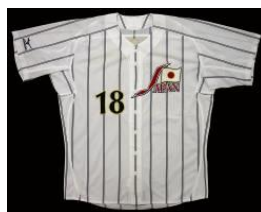
松坂大輔選手のユニホーム/ シドニー2000オリンピック アテネ2004オリンピック (公益財団法人野球殿堂博物館蔵)