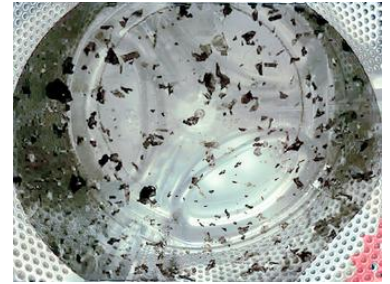
【カビトルネード使用後の洗濯槽】