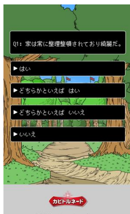
【性格面に関する質問】